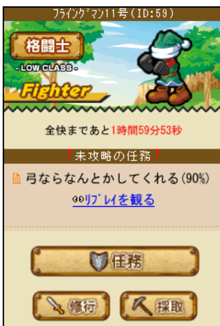
▲「マイタウン」はシンプルでわかりやすい

「伝説のまもりびと by GMO」は、キャラクターを育て、仲間と一緒に敵の侵入を阻止する新感覚タワーディフェンスRPGです。ゲームの基本は迫りくる敵を迎え撃ち、敵の侵入を阻止する「任務」をたくさんこなすこと。敵を逃さず倒すためには、戦略と心強い仲間、そして強い力と武器が必要です。これらを揃えて敵を迎え撃ち、最強のまもりびとを目指しましょう！