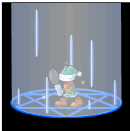
▲「見習い」から新たな職業に転職！

プレイヤーのキャラクターは「戦士」や「格闘士」をはじめ、さまざまな職業に就くことができます。最初は「見習い」しか選べませんが、ひとつの職業を極めるごとに、選べる職業が増えていきます。職業は18種類、さらに謎に包まれた職業も多数。複数の職業を極めなければ就けない高レベルの職業もあります。職業ごとに装備できる武器や得意とする敵が違うので、それぞれの職業の特徴を生かして任務をこなしましょう。