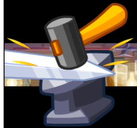
▲武器は鍛えればもっと強くなる！

また、作った武器はさらに精錬することで強さが増します。世界にたった一つの、オリジナルの最強武器を作りましょう！