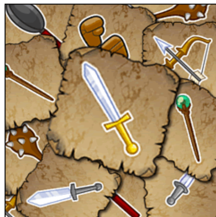
▲様々な武器と職業がこのゲームの特徴