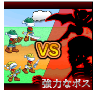
▲みんなで協力して倒そう！

たくさんの「任務」をこなし、ゲームを進めていくと、ボス敵が出現します。ボス敵には武器の付加効果による影響が少なかったりする為、非常に強力な存在となっていて「おともびと」では力不足。友達を誘って頼りになる仲間を集め、みんなで協力してボスを倒しましょう！ボスを倒した先には新しい職業が待っています！