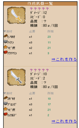
▲武器を作るのが強さの秘訣