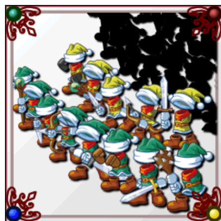
▲さまざまな職業を使いこなそう