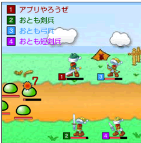
▲白熱の戦闘シーン。精鋭を揃えて

また、任務に連れていく仲間の編成によって、結果も大きく変わります。登場するモンスターの属性を踏まえ、攻撃速度や攻撃力、武器、特性などを参考に編成するのが任務成功のコツです。完全防衛するとスコアが増え、上位者は全プレイヤーによる「伝説度ランキング」に載ります。ランキング入りを目指し、全任務の制覇を目指しましょう！