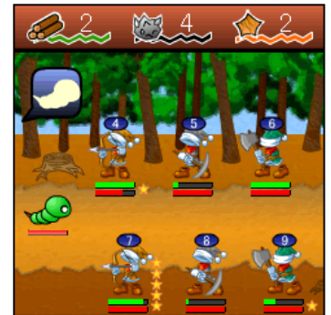
▲キャラクターによって得意な採集素材が違うので、配置のしかたも肝心

「採取」をやり込めばやり込むほど、採れる素材は増えていきます。またゲームを進めると採集できる場所が増えていき、集められる素材の種類も増えて、さまざまな武器をつくれるようになっていきます。